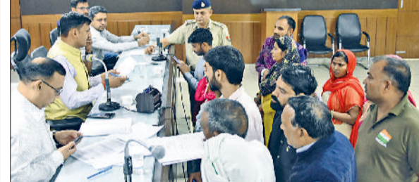
पानीपत। जिला सचिवालय में जनसुनवाई करते हुए अधिकारीगण।