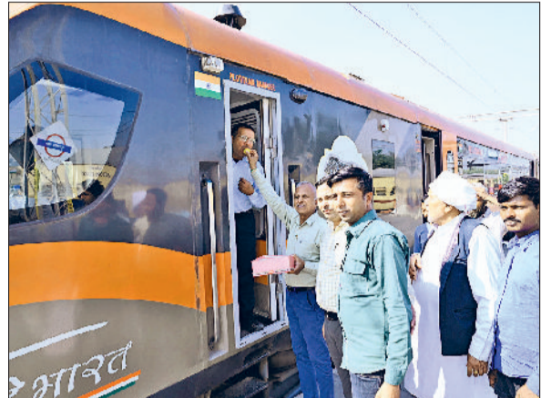
कुरुक्षेत्र। 'वंदे भारत' ट्रेन के ड्राइवर का मुंह मीठा कराते सांसद नवीन जिनंदल के समर्थक।