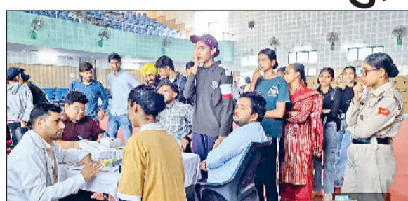
अंबाला। मेडिकल चेकअप करवाते छात्र।