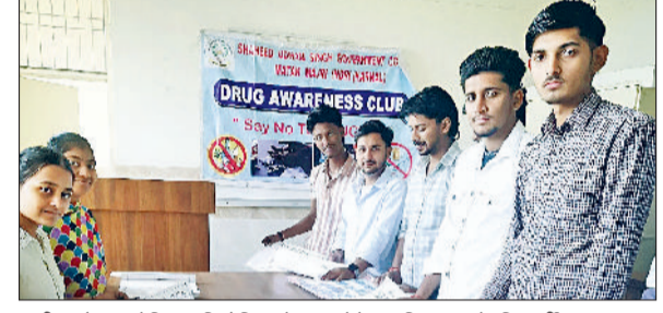
इंदी 2 पोस्टर मेकिंग प्रतियोगिता में भाग लेते महाविद्यालय के विद्यार्थी।

हरिभूमि न्यूज इंदी शहीद उधम सिंह राजकीय महाविद्यालय मटक माजरी इंदी नशा मुक्त भारत अभियान कार्यक्रम के तहत नशे को न कहें विषय पर एक पोस्टर मेकिंग प्रतियोगिता और नारा लेखन प्रतियोगिता का आयोजन किया गया। प्रतियोगिताओं का मुख्य उद्देश्य छात्रों में नशीली दवाओं के दुरुपयोग के हानिकारक प्रभावों के बारे में जागरूकता पैदा करना और उन्हें स्वस्थ, नशा मुक्त जीवन जीने के लिए प्रोत्साहित करना था। बीएससी, बीए, बीकॉम कक्षाओं के छात्रों ने भाग लिया। उन्होंने नशीली दवाओं के उपयोग के खिलाफ मजबूत संदेश देने वाले