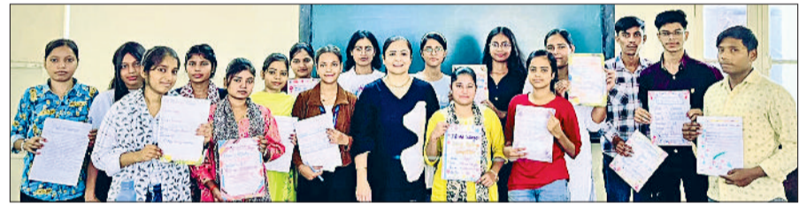
पानीपत। आईबी कॉलेज में विजेता विद्यार्थी प्रसन्न मुद्रा में।