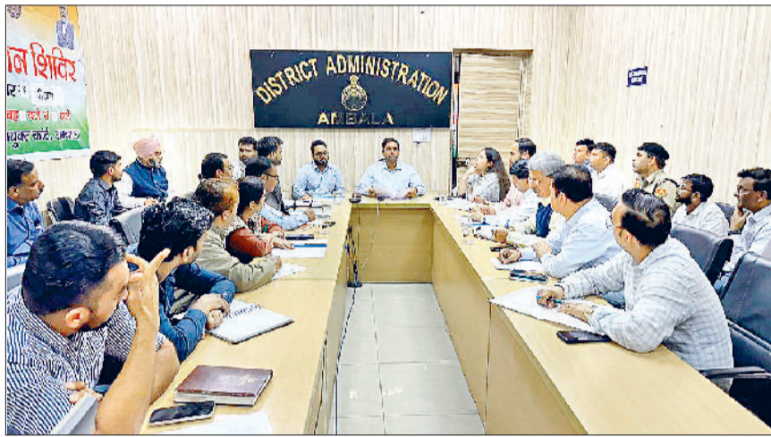
अंबाला। मीटिंग में मौजूद अधिकारी।

हॉकी एस्ट्रोड्रफ मैदान और 4 लेन सिंथेटिक एथलेटिक ट्रैक का भी किया जाएगा शिलान्यास, मुख्यमंत्री नायब सिंह सैनी बतौर मुख्य अतिथि शिरकत करेंगे